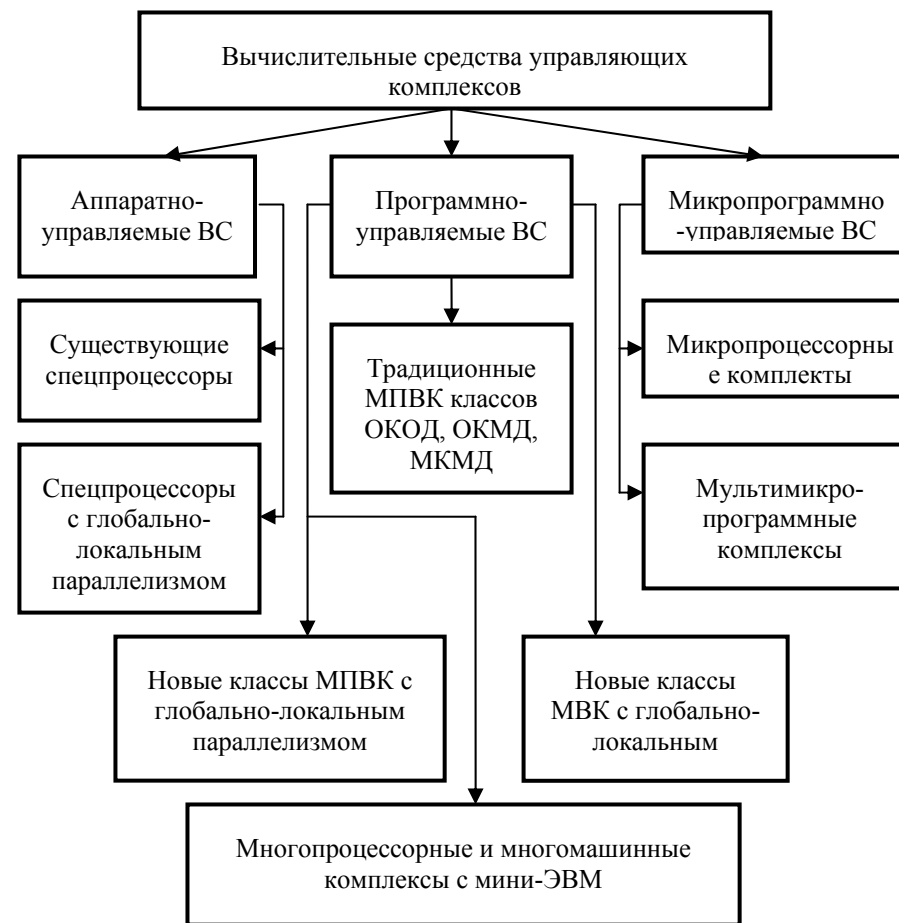
Рис. 2. Классы вычислительных средств управляющих комплексов реального времени

- глобального параллелизма , заключающегося в одновременном выполнении в каждый момент времени максимально возможного (или необходимого) количества независимых операций одного или нескольких одновременно реализуемых алгоритмов;