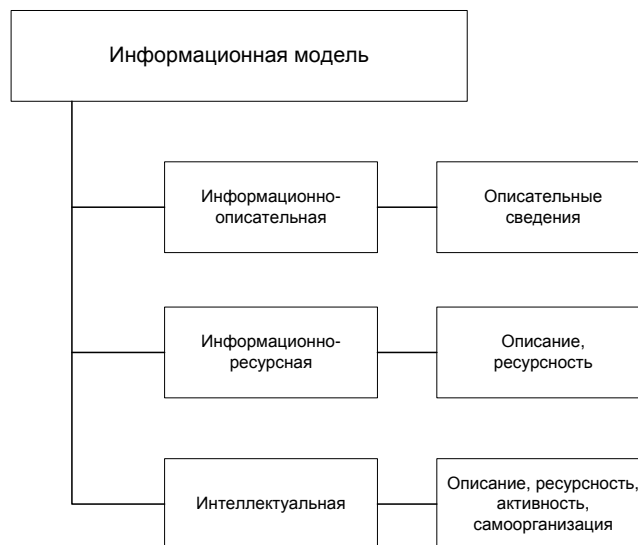
Рис. 1 – Классификация информационных моделей

Также в своей работе В.П. Савиных применяет три типа информационных моделей (рис. 1), а именно информационно-описательные, ресурсные, интеллектуальные [14].