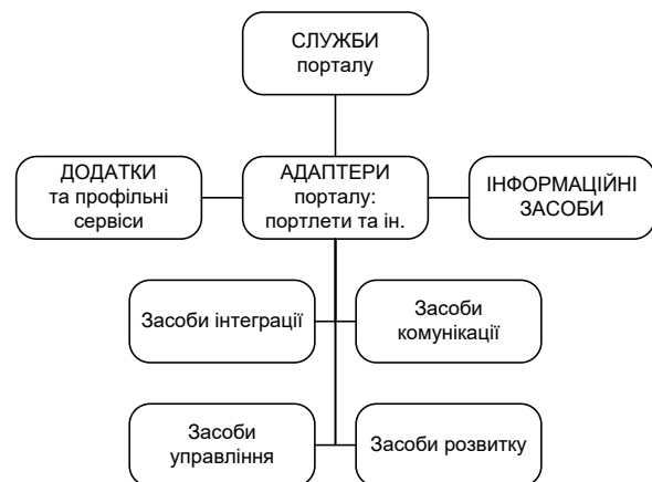
Рис. 1. Структура типового корпоративного інформаційного порталу

Функціональні компоненти порталу представлені на рис. 1.