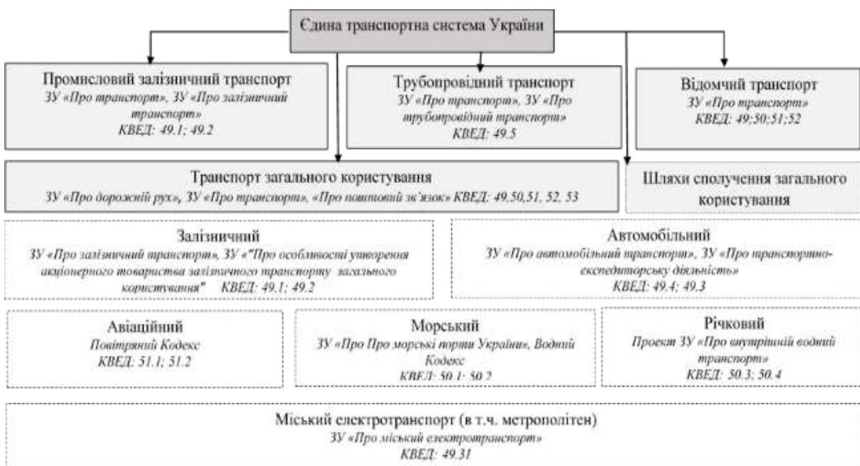
Рис. 1. Склад Єдиної транспортної системи України (побудовано на основі [2–4, 2–12, 15–19])