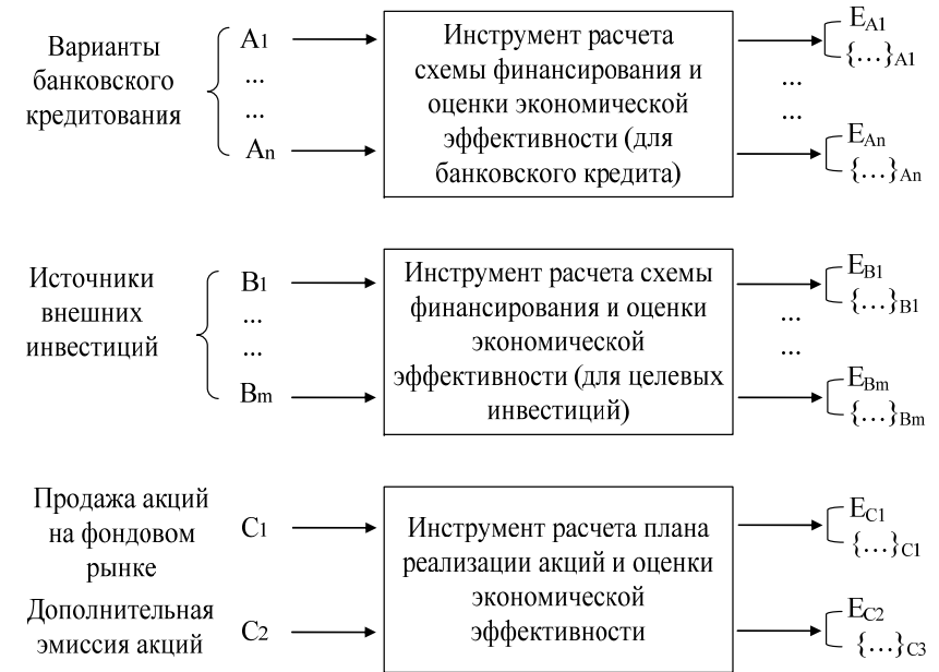
Рис. 1. Общая схема выбора оптимального источника финансирования

функции планирования или оптимизации расписаний. Для них более важным является простота использования и скорость получения результата.